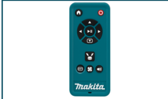
Afstandbediening (1 stuks) - 620H54-5 - 8720023162852