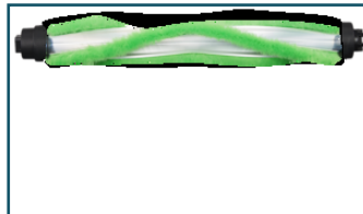
Borstelset zacht (1 stuks) - 191P20-2 - 0088381585385