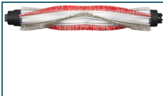
Borstelset Standaard (1 stuks) - 191P22-8 - 0088381585392