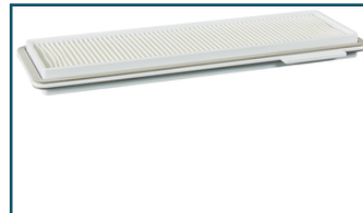
Filterset H (1 stuks) - 191P31-7 - 0088381585439